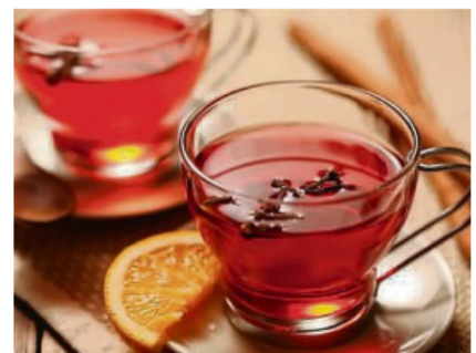
Auf die Besucher warten unter anderem Glühwein, warmer Aperol oder heißer Hugo.