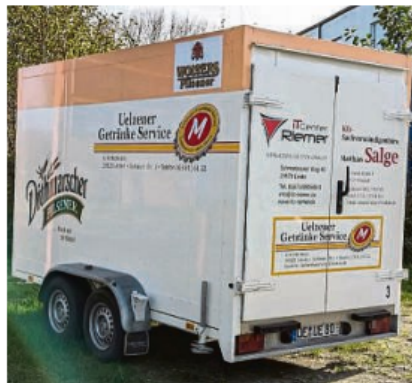
Unverzichtbar für den Getränke Service: der Kühlwagen.