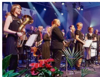
Die Ebstorfer Musikgemeinschaft (EMG) reist mit einer 20-köpfigen Kapelle an und spielt Weihnachtslieder.

Wer dagegen noch eine Tanne fürs Fest braucht, der wird beim Adventszauber vielleicht auch fündig. Denn bis etwa 16 Uhr werden auf dem Hof des Uelzener Getränke Services auch Weihnachtsbäume verkauft. Weil so viel weihnachtlicher Trubel bekanntlich hungrig macht, sollen auch die Gaumenfreuden nicht zu kurz kommen. Die Besucher erwartet eine große Auswahl süßer und herzhafter Leckereien. Kuchen, Crêpes, Bratwurst,