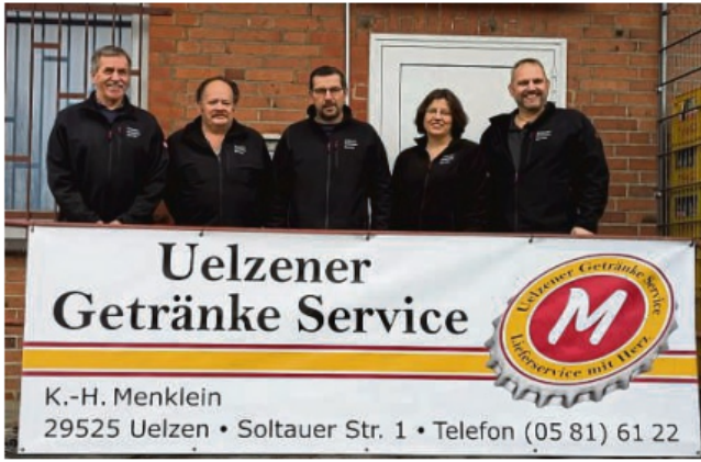
Das Team des Uelzener Getränke Services kennt jede Bestellung genau.