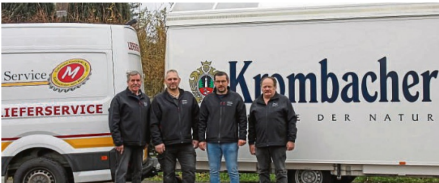
Mit einem Schankwagen ist das Team erfolgreich im Einsatz auf Feiern, Partys, Jubiläen oder Polterabenden.